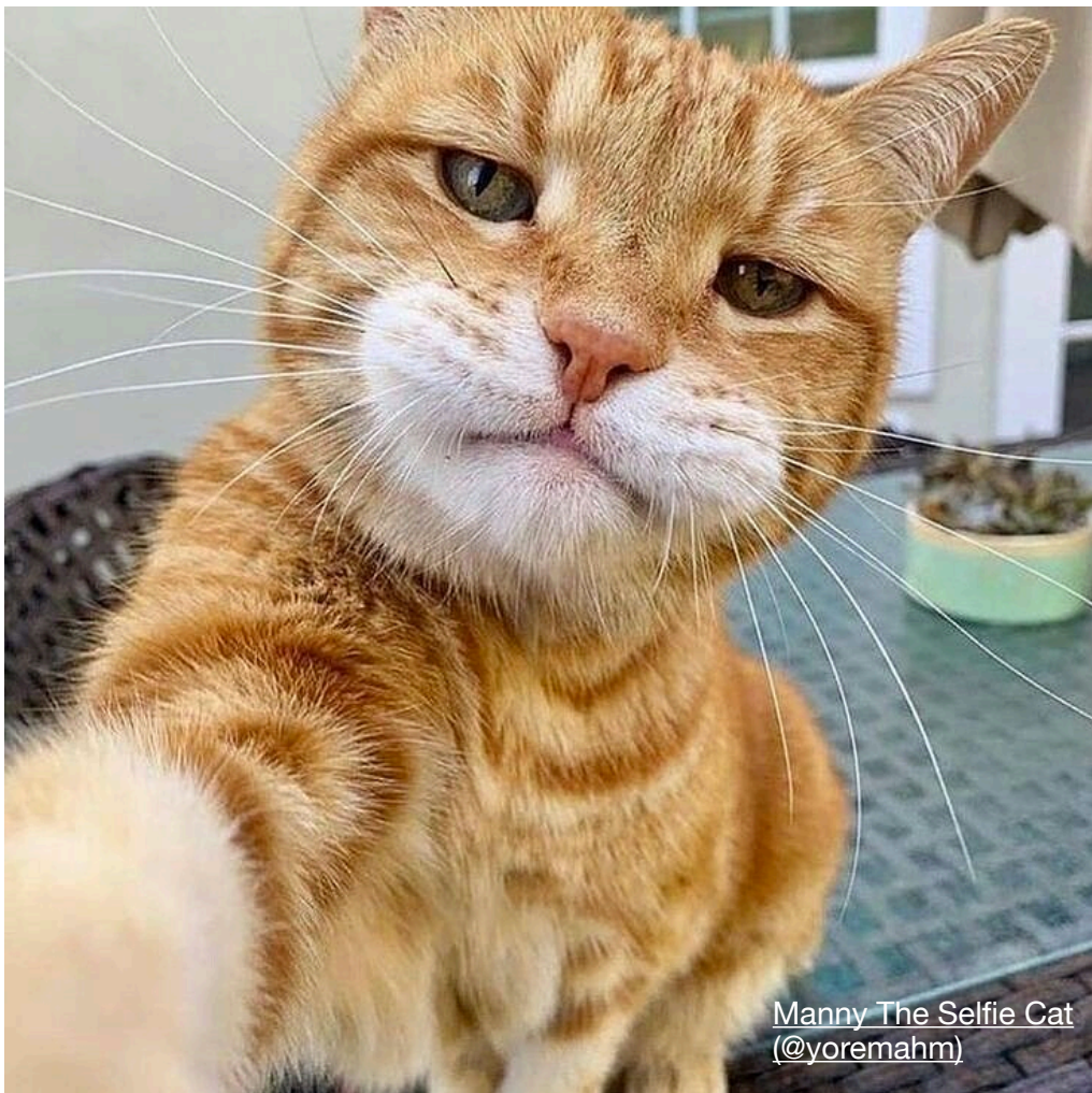
Manny The Selfie Cat (@yoremahm)

邀請參加者自拍 / 我作為攝影師為您拍攝 第一張人像照，為參加者拍下能夠代表自己的一面。選擇自拍 / 攝影師操刀的意義在於賦於參加者自主權，透過攝影行為自己與自己對話，揀選能夠代表自己的照片，「自己定義自己」。